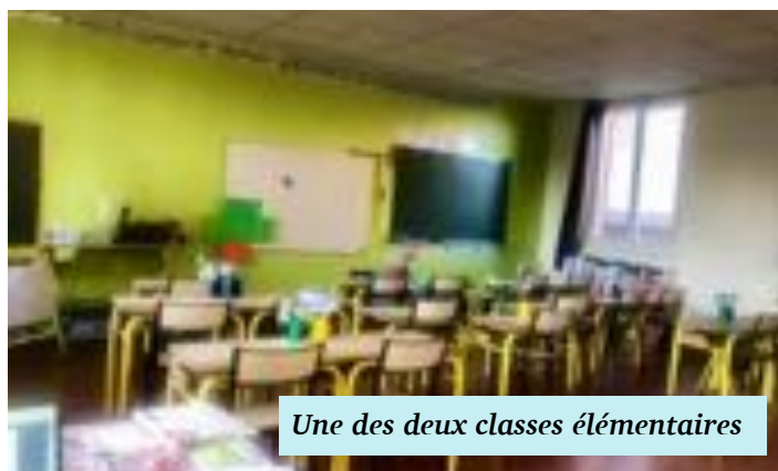
Une des deux classes élémentaires

Les élus des communes de Vertain et de Romeries ont remis les prix à tous les élèves, dont des dictionnaires