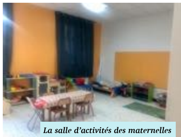
La salle d'activités des maternelles