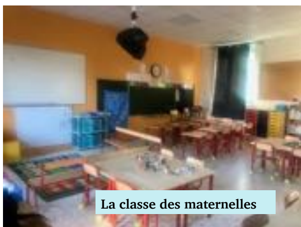
La classe des maternelles

Beaucoup de nouveautés pour cette rentrée des classes.... Les enfants ont intégré des lieux flambants neufs. Les locaux accueillants les différentes classes sont maintenant accessibles aux personnes à mobilité réduite grâce à la réfection complète des sanitaires, les classes ont été repeintes et réaménagées pour l'ouverture de la troisième classe.