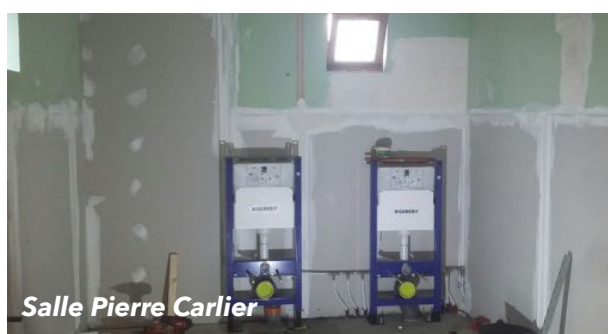
Salle Pierre Carlier