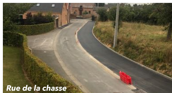
Rue de la chasse